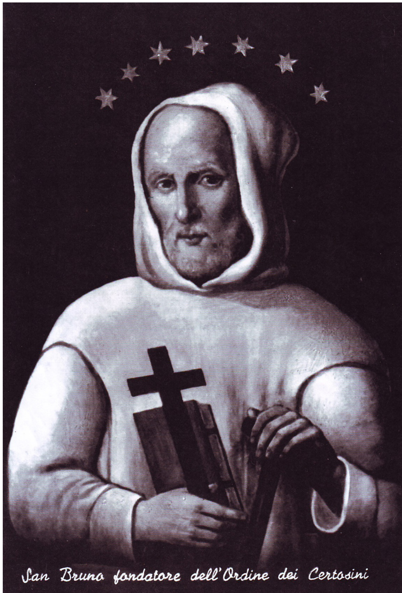
San Bruno fondatore dell'Ordine dei Certosini